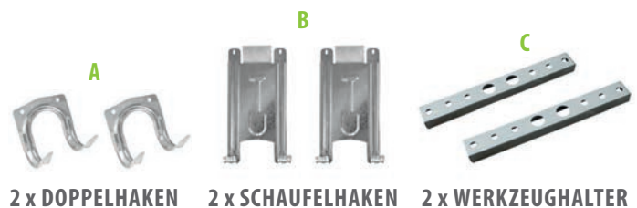
2 x DOPPELHAKEN